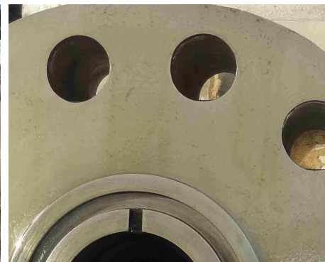
Detalle de la brida