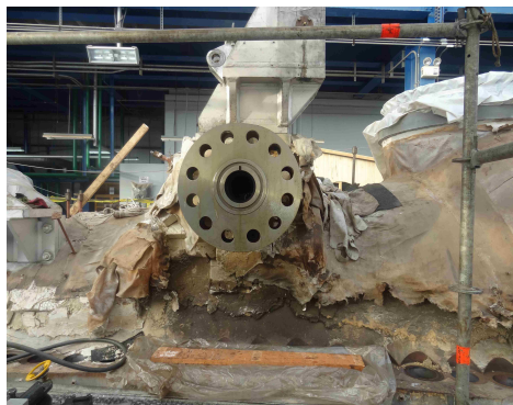
Brida terminada