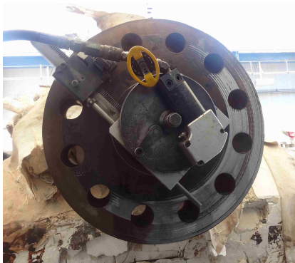
Inicio del maquinando